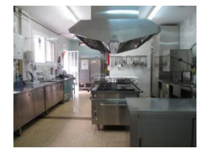
Menjador amb cuina pròpia