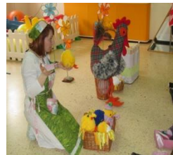
Ens visiten altres professionals.

Reforçar els llaços de col·laboració i participació per mitjà dels tallers amb famílies: