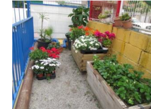
Jardí - Hort