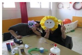
Taller de màscares