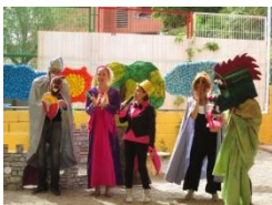
Taller de teatre

Reforçar els llaços de col·laboració i participació per mitjà dels tallers amb famílies: