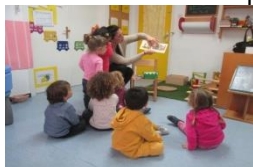
Taller de contes