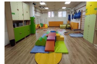
Sala d'usos múltiples