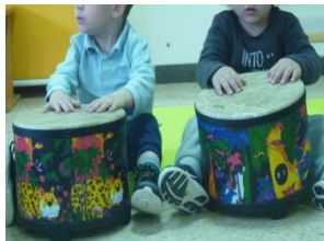
Taller de percussió