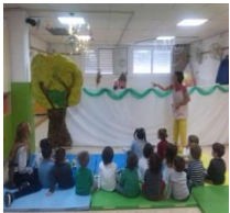
Taller de contes

Volem desenvolupar les capacitats dels infants, mitjançant el joc, de manera globalitzada i respectant la individualitat. Posant en valor la vida quotidiana, els hàbits i la autonomia, per mitjà de propostes i tallers educatius.