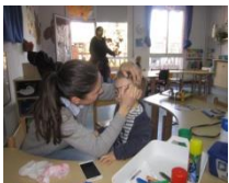
Taller de maquillatge