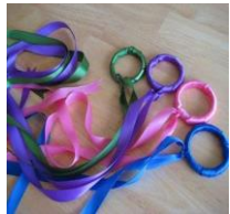
Proposta per a nadons