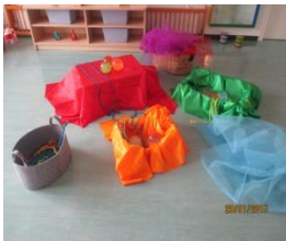
Proposta per a 1-2 anys