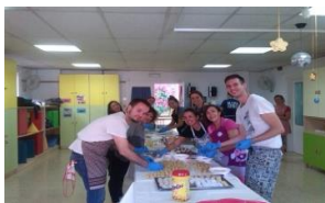
Taller de panellets