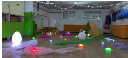
Taller de llum